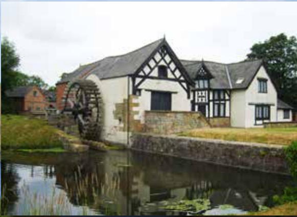
Melin Yr Orsedd, Wrecsam – Melin Restredig Gradd II* o'r 16eg ganrif gyda pheiriannau gyrru sy'n goroesi, yn cynnwys olwyn pwll, ymdrybaeddwr, ac olwyn sbardun mawr