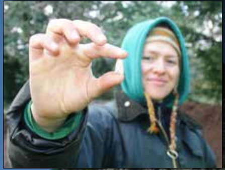
Darganfyddiad annisgwyl yn ystod gwaith cloddio yng Ngardd yr Arglwydd microllith fflint

Yn gynharach eleni, fe ymunodd grwpiau ysgolion lleol a gwirfoddolwyr brwd â staff CPAT i gloddio twmpath hynod yng Ngardd yr Arglwydd yn Nantclwyd y Dre. Mae tŷ Nantclwyd y Dre, sy'n fwy na 500 mlwydd oed, yn adeilad Rhestredig Gradd I, ac mae'r gerddi wedi'u dynodi'n Radd II. Ein nod oedd ymchwilio i nifer o ddamcaniaethau sydd wedi'u cynnig i esbonio'r twmpath. Mae'n bosibl iddo fod â chysylltiad â gwarchae yn ystod y Rhyfel Cartref, efallai fel safle canonau yn tremio dros gastell Rhuthun. Neu efallai mai llwyfan i fwynhau golygfeydd o'r ardd ydoedd. Ond fel mae'n digwydd bod, twmpath mwy diweddar ydy hwn, wedi'i lunio o rwbel adeiladu o dŷ Nantclwyd y Dre.