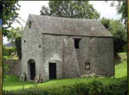
Melin-y-Wern, melin yd Restredig Gradd II, Llanbedr Dyffryn Clwyd

Mae gan lawer o felinau hanes hir iawn; mae rhai wedi goroesi fwy neu lai yn gyflawn tra bo eraill fawr mwy na gwrthgloddiau. Mae'r prosiect hwn yn ailedrych ar Adeiladau Rhestredig neu Henebion Rhestredig yr edrychwyd arny'n nhw gyntaf yn y 1990au. Diben y gwaith yw adolygu cyflwr pob safle i weld a oes angen newid y ffordd o'u gwarchod o gwbl.