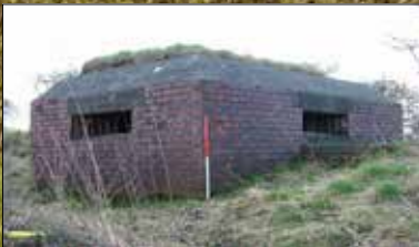
Diffyniad a adeiladwyd i warchod RAF Sealand.

Mae'n bosibl defnyddio Archwilio i gyrchu'r adroddiadau terfynol ar bob un o'r prosiectau rydym ni'n sôn amdany'n nhw yn y cylchlythyr hwn – yn ogystal â'n holl waith arall – ac mae crynodebau ar gael ar wefan CPAT.