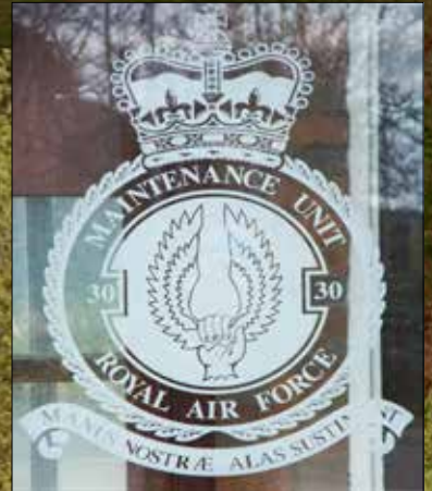
Arfbais Uned Cynhalieth 30, RAF